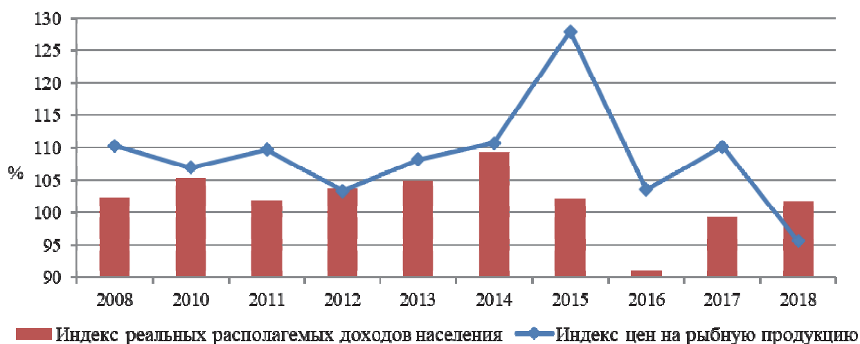
Рис. 1. Индексы реальных располагаемых доходов населения Приморского края и потребительских цен на рыбную продукцию за 2008–2018 гг. (декабрь в % к декабрю предыдущего года)